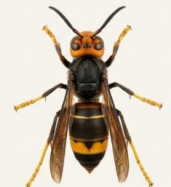
Frelon asiatique ( Vespa velutina )