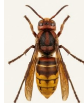
Frelon européen ( Vespa crabro )